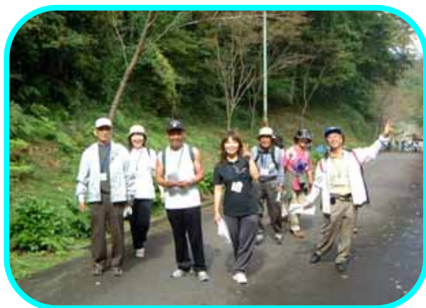
上りも下りもあります