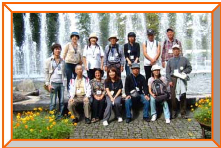
みんなで記念撮影！