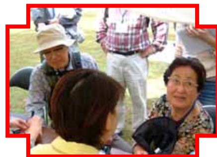
前後で血糖・血圧を測ります