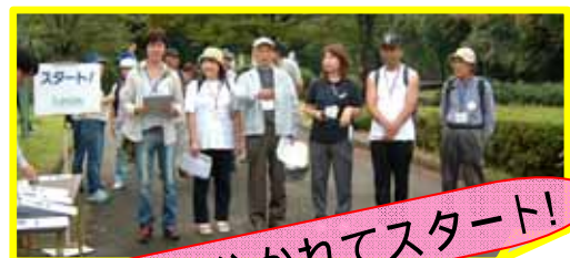
2チームに分かれてスタート!