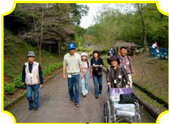
天気も景色もいいですよ！